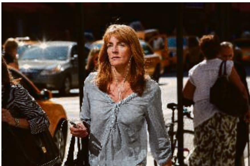
Man begynder at digte på »filmen« ud fra fotos af samme person taget med måneders mellemrum. Bar hun på en sorg, er blevet glad igen?